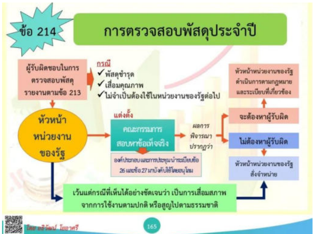
ภาพประกอบ ข้อ ๒๑๓ การตรวจสอบพัสดุประจำปี

ถ้าผลการพิจารณาปรากฏว่า จะต้องหาตัวผู้รับผิดชอบ ให้หัวหน้าหน่วยงานของรัฐดำเนินการตามกฎหมายและระเบียบที่เกี่ยวข้องของทางราชการหรือของหน่วยงานของรัฐนั้นต่อไป