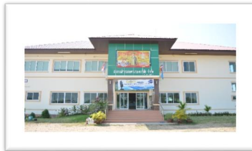
โรงสีสหกรณ์การเกษตรเกษตรวิสัย จำกัด (สาขานกเหาะ) มีเนื้อที่ ๔๕ไร่ ปัจจุบันตั้งอยู่ที่ ๒๑๕ ม.๑๑ บ้านนกเหาะ ต.ดงครั้งใหญ่ อ.เกษตรวิสัย จ.ร้อยเอ็ด มีโรงสี กำลังการผลิต ๑๒๐ ตัน/วันมีโกดัง ๖ โกดัง เก็บได้ ๘,๕๐๐ ตัน มีไซโล ๕๐๐ ตัน มีลานตาก ๑๖,๒๐๐ ตร.ม. มีโรงอบลดความชื้น ๖๐๐ ตันต่อวัน ปัจจุบัน สหกรณ์ฯ กำลังก่อสร้างไซโลเป่าเย็น รักษาอุณหภูมิเพื่อรักษาความหอมของข้าวหอมมะลิได้ ตลอดทั้งปี ขนาดความจุ ๑๐,๐๐๐ตัน