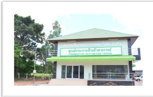
สำนักงานใหญ่ สหกรณ์การเกษตรเกษตรวิสัย จำกัด มีเนื้อที่ ๖ ไร่ ปัจจุบันตั้งอยู่ที่ ๒๐๖ ม.๒ ต.เกษตรวิสัย อ.เกษตรวิสัย จ.ร้อยเอ็ด มีโกดัง ๓ โกดัง เก็บ สินค้าได้ ๖,๐๐๐ ตัน มีลานตากขนาด ๓,๒๐๐ ตร.ม.

ปัจจุบันสหกรณ์ได้ก้าวเข้าสู่ความเป็นผู้นำในด้านธุรกิจอย่างครบวงจร โดยคณะกรรมการสหกรณ์หมุนเวียนเข้าดูแลช่วยเหลือในกิจการงานสหกรณ์ ๑๕ คน มีพนักงานสหกรณ์ ๕๐ คน ลูกจ้างประจำ ๑๒ คน ซึ่งมีสมาชิกทั้งหมด ๘,๗๐๖ คน สังกัดตามหมู่บ้านต่างๆ จำนวน ๑๓ ตำบล จำนวน ๑๕๒ กลุ่ม อีกทั้งสหกรณ์มีอุปกรณ์ที่คอยให้บริการอย่างครบครันไว้คอยให้บริการสมาชิกและเกษตรกรทั่วไป